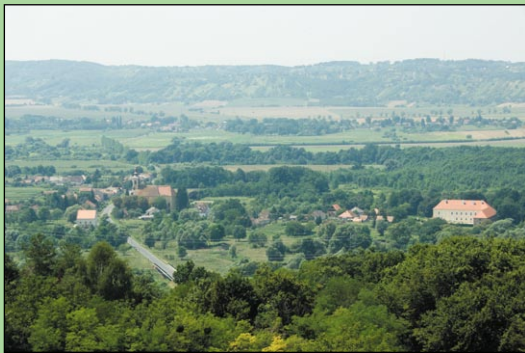
A kilátópontokról megcsodálhatók a Kerka-völgy értékei - Szécsisziget

A turizmusfejlesztés, mint a térség egyik lehetséges pontja, összehangolható a természeti értékek megőrzésével, melynek egyik lehetséges módja az ökoturisztikai fejlesztések elindítása.