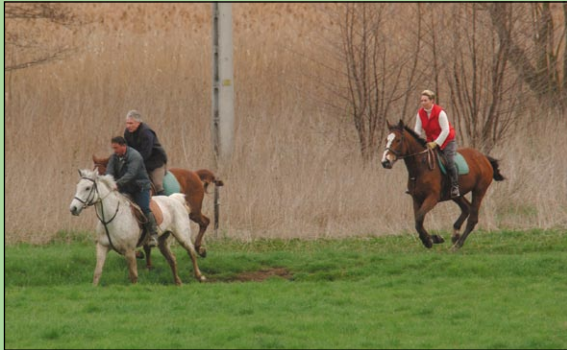
A lovasok az ökoturizmus támogatói

A zöldutak segítik az egészséges életmódhoz kötődő programok megvalósítását is, hiszen jó lehetőséget kínálnak gyaloglásra, kerékpározásra és még sok más sportolásra. Közelségükkel és könnyű elérhetőségükkel rövidebb túrákra, kirándulásokra is csábíthatja az otthon ülés helyett az embereket.