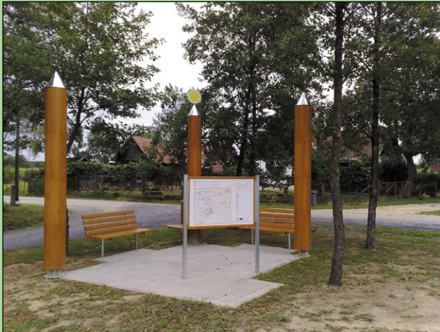
A megújuló energia út egyik állomása - Szentgyörgyvölgy

A megújuló energia útvonal mentén számos bemutató állomás szemlélteti, hogy milyen lehetőségekkel lehetne az energiákat hasznosítani. A külföldi példa nyomán megvalósított program osztrák, szlovén és magyar területen áthaladó 12 útvonalat foglal magába, amelyeken összesen 32 bemutató állomáson ismerhetjük meg a megújuló energiák felhasználását.